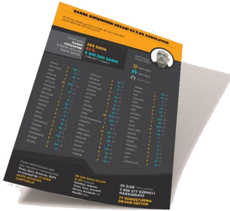
شكل 4 يسأل حساب محاولة الانقلاب في 62 ولاية

يتم فحص الأدلة بتفاصيلها في جميع أنحاء تركيا. وتستمر الجلسات وتجري محاكمة المتهمين .