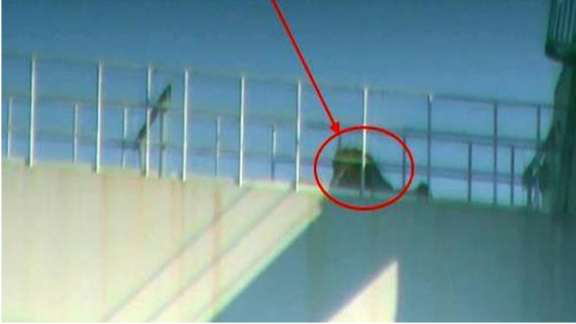
شكل 5 صورة قريبة للرافعة الموجودة على الجسر 6

مع كل ذلك، فإن أولئك الذين يقومون بحملة التشويه ضد صادات لا يترددون في نشر أي نوع من الأكاذيب لمصالحهم الخاصة. إنهم لا يعرفون حدود لقلّة الأخلاق.