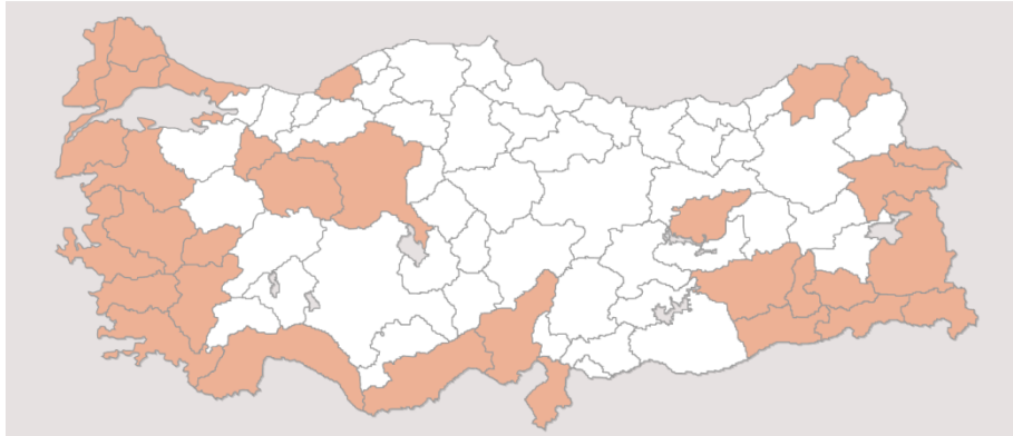
الشكل 8 نتائج الإفتاء 16