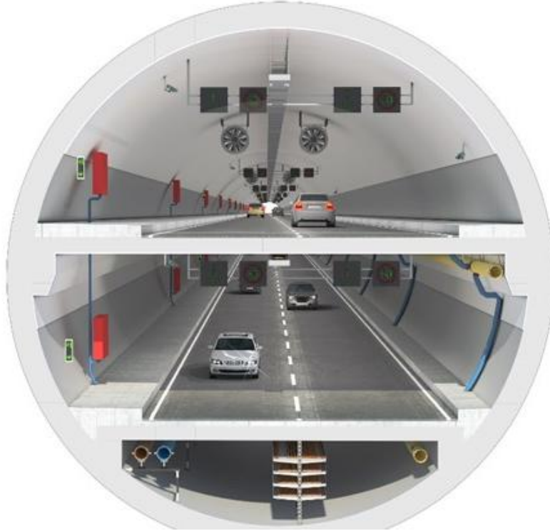
الشكل 9 نفق أوراسيا 17

تمضي تركيا في طريقها لتصبح من أكثر البلدان إزدهاراً وأكثرها تطوراً ورفاهيةً في العالم. وذلك بفضل المشاريع الكبيرة مثل جسر البوسفور الثالث، والأنفاق تحت المضيق، وجسر إتصال الخليج، والمطار الثالث، ومشروع قناة إسطنبول. ناهيك عن المشاريع المماثلة، لا يمكن أن تقوم بتنفيذ مشروع شبيه واحد عدة دول مجتمعة مع بعضها البعض حتى في دولة ما .