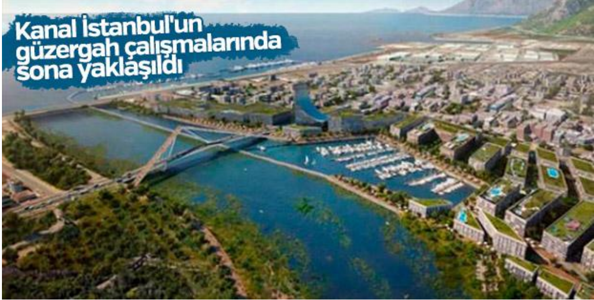
الشكل 12 تم تحديد المسار في قناة إسطنبول 20

تعرضت مشاريع العصر (حسب التعبيرات) التي تنفذها تركيا لكافة العرقلات من قبل الدول التي تعد منافسة لتركيا .