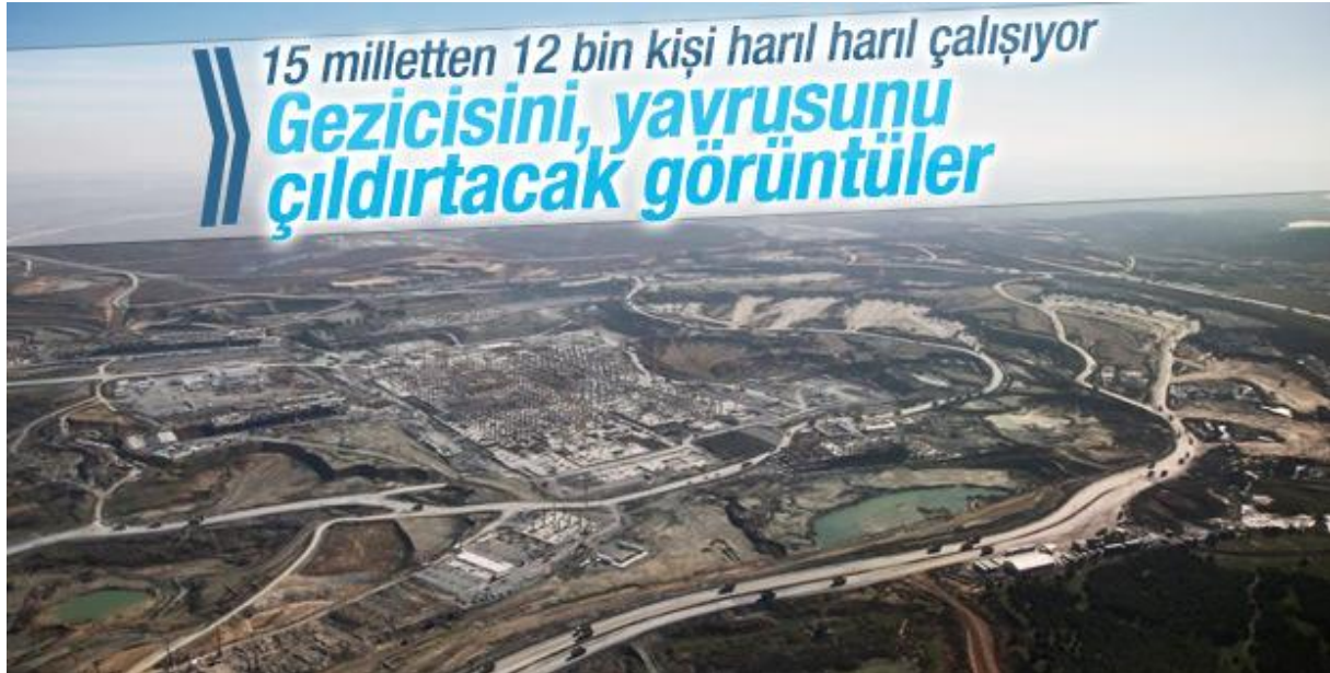
الشكل 11 إنشاء المطار الثالث 19