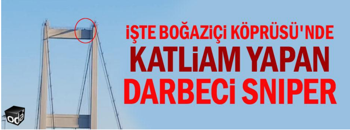
شكل 1 بتاريخ 21 تموز يوليو في خبر ODATV صورة مأخوذة نهراً لإحداث تصور بوجود قناص

زعمو أن هنالك قناصاً فوق الجسر وأنه هو المسؤول عن الوفيات التي حصلت على الجسر. ومن أجل أن تكون مزاعمهم ذات مصداقية، إستخدمو صورة لسواد فوق سيقان الجسر. 2 3