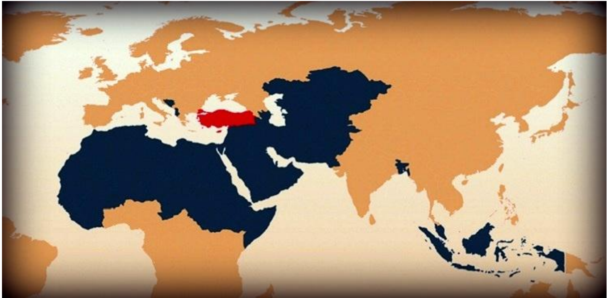
الشكل 16 العملاء المحتملين لصادات المساهمة 28

مامعنى كل هذا الرسم والكتابة بأن هنالك شبهات كثيرة بهذا الطريق، بما أن كل شئى واضح جداً، لماذا يقال عن غرض صادرات المساهمة أنها قد تكون فيها أمور غير قانونية.