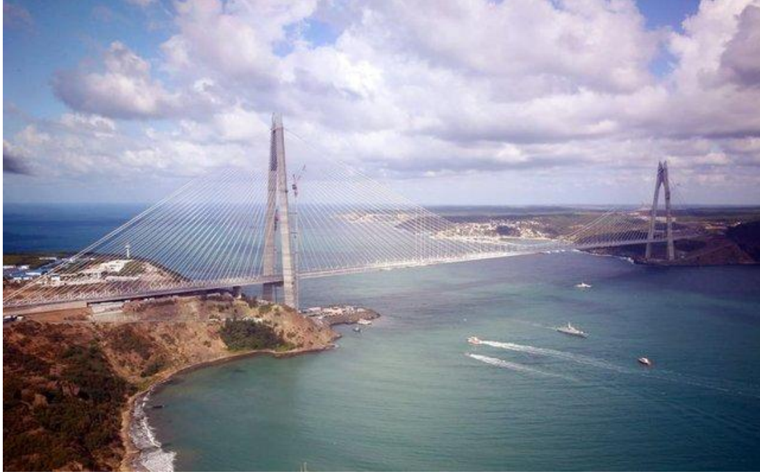
الشكل 10 جسر السلطان ياوز سليم / الجسر الثالث . 18