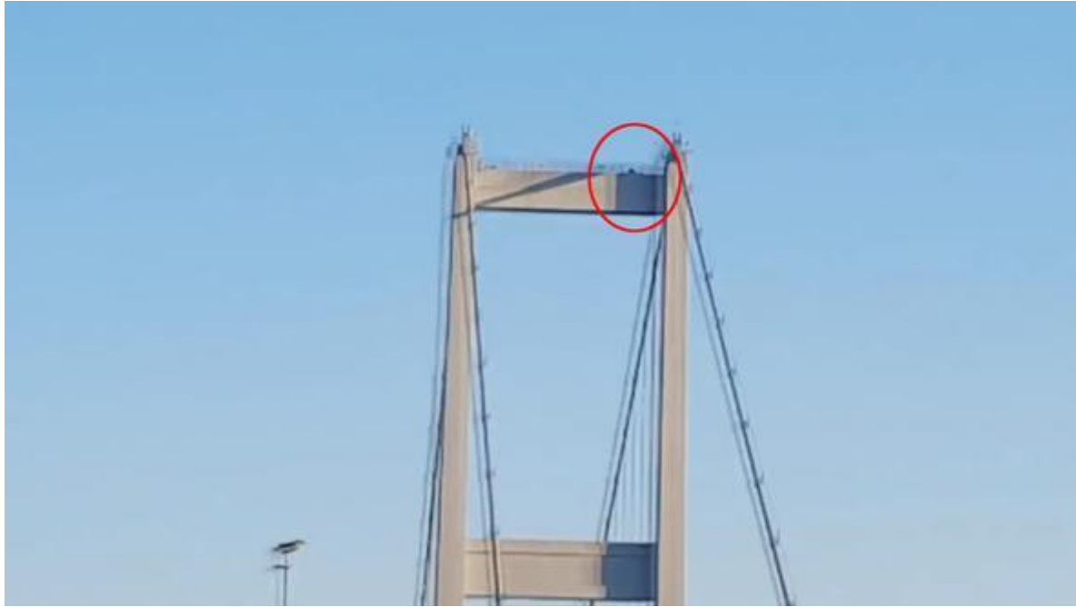
الشكل 2 صحيفة حرييت بتاريخ 21 تموز يوليو 2016 http://www.hurriyet.com.tr/koprude-keskin-nisanci-varmis-40156647