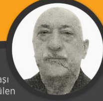
FETÖ elebaşı Fetullah Gülen

FETÖ'nün darbe girişimine ilişkin 62 ilde 6 bin 880 sanık hakkında 269 dava açıldı