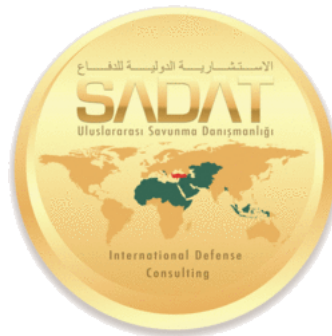
الشكل 1 حافظتنا كعملاء من الدول

صادات المساهمة وفقاً لما يلائم مهمتها حددت الدول الصديقة والحليفة التي س وف تقدم لها خدماتها وأعلنت عنها في شعارها .